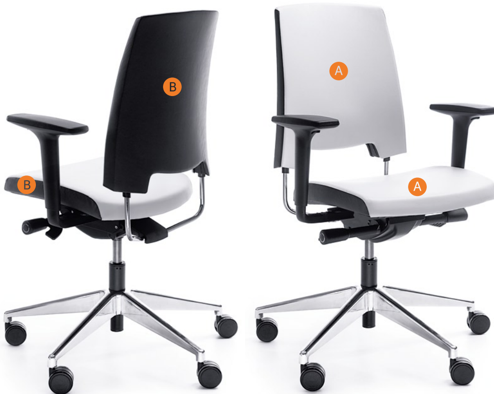
ARCA 21SL CHROM P51PU

Please clearly indicate in the order symbols of the upholstery colours, e.g. SL-28/SL-18 (where SL-28 - A, SL-18 - B).