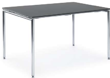
SENSI S2 CHROME