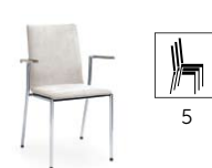
SENSi K4H 2P

H 880 / W 570 / D 540 h 480 / w 430 / d 380