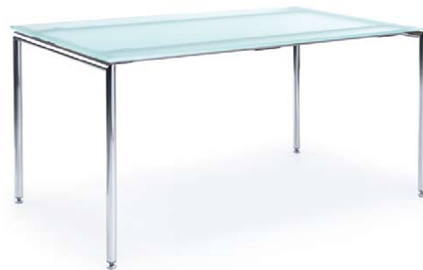
SENSI S4 CHROME