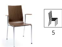
SENSi K1H 2P

H 870 / W 570 / D 540 h 460 / w 420 / d 390