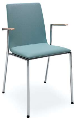
SENSI K4H CHROME 2P