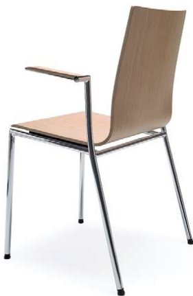
SENSI K1H CHROME 2P