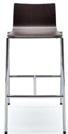
SENSI K1CH CHROME