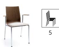
SENSi K2H 2P

H 870 / W 570 / D 540 h 480 / w 410 / d 410