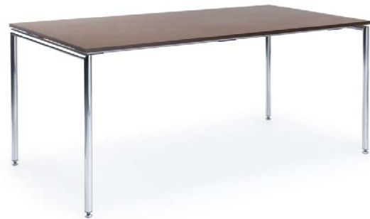
SENSI S1 CHROME