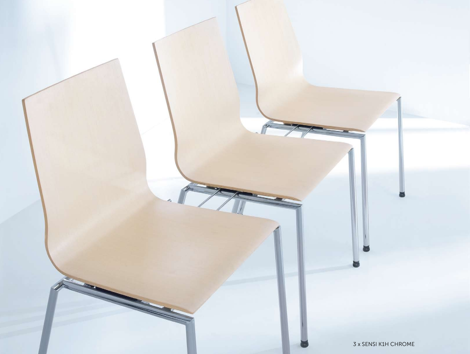
3 x SENSI K1H CHROME