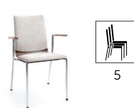
SENSi K3H 2P

H 870 / W 570 / D 540 h 480 / w 420 / d 400