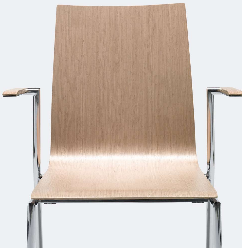
SENSI K1H CHROME 2P