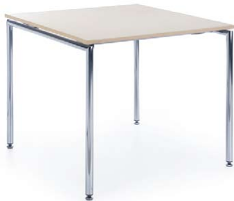
SENSI S3 CHROME