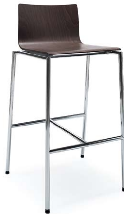
SENSI K1CH CHROME