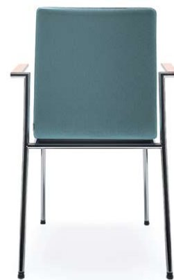
SENSI K4H CHROME 2P